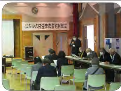
令和3年度定期総会の様子