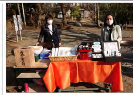
一般公開日の受付風景(2/7)