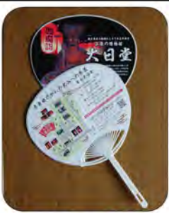
参加者に配った「うちわ」

8月16日、あいにくの雨模様の中ではありませんでしたが、閻魔詣を開催する事ができました。昨年は新型コロナウイルスの為、やむなく中止としましたが、今年は何とか規模を縮小しての開催になりました。その為、大日堂本堂での「紙芝居」は中止とし、飲食の提供も中止としました。