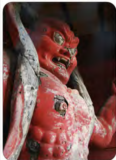
二王像(阿形)平安時代作

本年8月18日付で、本会が「特定非営利活動法人(特定NPO法人)」として、7月18日の役員会で承認された。これは、本会が「特定非営利活動法人」に移行することを目的として、役員会で承認された。本会が「特定非営利活動法人」に移行することを目的として、役員会で承認された。本会が「特定非営利活動法人」に移行することを目的として、役員会で承認された。