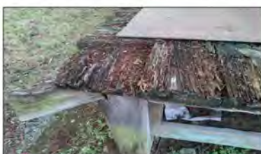
大日堂の縁側の角。縁が腐って危ない