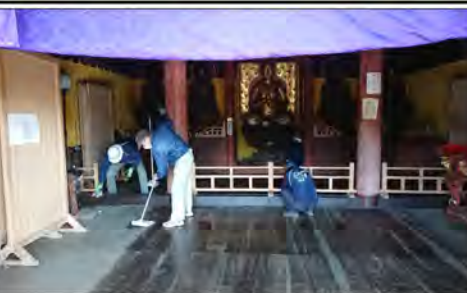
本堂も椅子など出して、綺麗に拭き掃除

行いました。役員、会員だけでなくボランティアの方や各部会からも参加していただき、大日堂・閻魔堂・不動堂に分かれて作業を行いました。各人が一年の感謝を込めて、すすを払い、掃き掃除、拭き掃除と各建物と仏像を、綺麗にしました。すす払いが終わり、清々しい気持ちになりました。解散となりました。