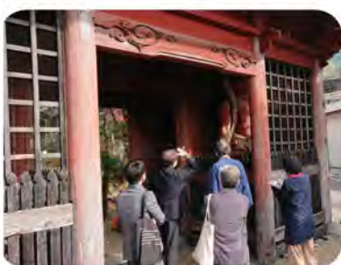
浅見先生と明珍先生で調査を

二王像修復にむけて調査 浅見先生のお話では、二王像の二王が修復に出ている間に、仁王門の修復をする事が望ましいとのことでした。