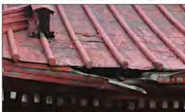
見積: 内田幸夫様 仁王門の屋根 すくなくても補修が必要