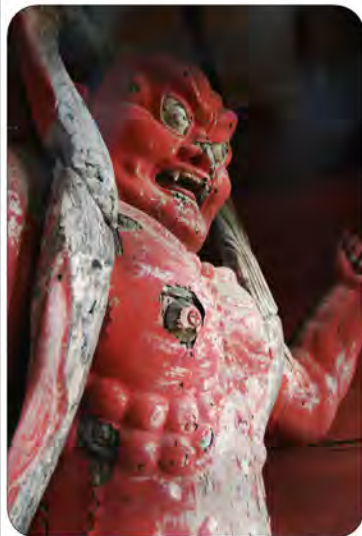
仁王門の二王像 (阿形像)

(※) 新型コロナウイルスの影響で今回の総会が中止(延期)になる場合は、一週間前よりホームページ ( http://www.minoge-bunka.org/ ) にてご案内します。またメール、電話でのお問い合わせも可能ですので、よろしくお願ひします。 ・メールアドレス: info@minoge-bunka.org ・電話: 宝蓮寺 0463-81-3528