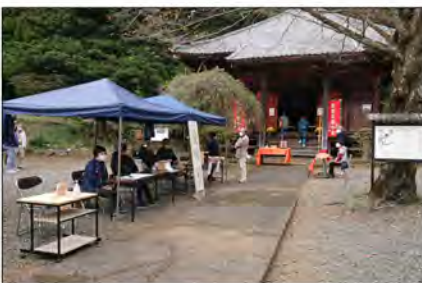
例年と違い、大日堂本堂手前も簡素に。

文化財保護強調週間 昨年の「文化財保護強調週間」では、例年特別公開が開催されたのですが、新型コロナの影響で中止となり、十一月一日から三日迄の三日間で特別公開を行いました。