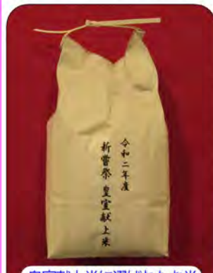
皇室献上米に選ばれたお米

閻魔詣・文化財特別公開などの行事に合わせて毎年献上していたいております。鶴巻の原様のお米が、皇室献上米に選ばれました。