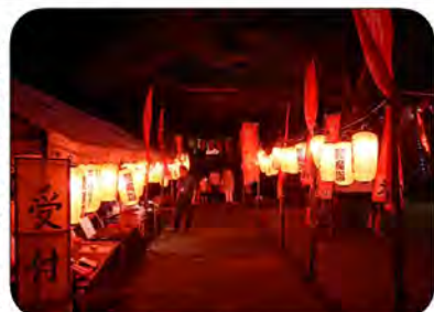
大日堂に向かう両側に提灯と幟

夏の思い出作りにお子様もご一緒にご家族で是非、ご来場下さい。お待ちしております。