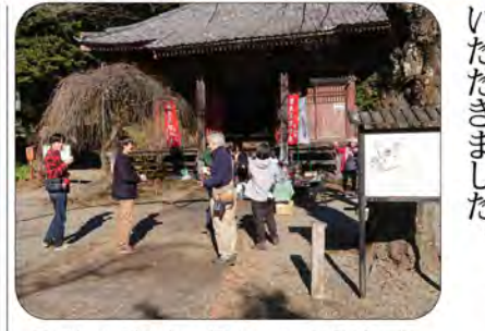
天気にも恵まれ、穏やかな 元日でした。