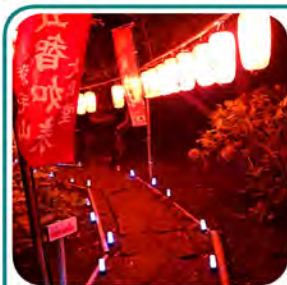
脇の小道に入り 少し歩くと、閻魔堂に到着です。

そして、毎年好評のお子様向けの紙芝居も例年通り行う予定です。大日堂前の境内では露大やケツズ販売も行う予定です。