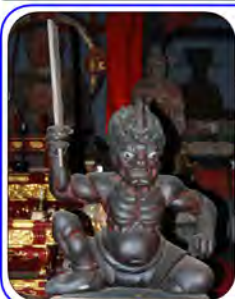
【鬼卒】右手右足の損傷が綺麗に修復されています。