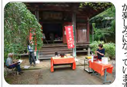
八月の一般公開の風景。暑い夏の日曜日。

元日の一般公開 令和になって初めての元旦の一般公開、新しい年号の新しい一年の最初の日、天気も晴れて、七十名以上の方々に参拝して頂きました。 今年は甘酒を二種類(アルコールの有・無)用意して、皆様に無料で飲んで頂きました。また、お札を新しく八種類作成し、販売させていただきました。