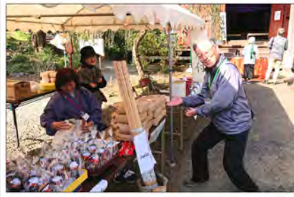
大日堂本堂手前で、餅米などの販売も