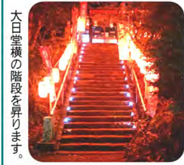
大日堂横の階段を昇ります。