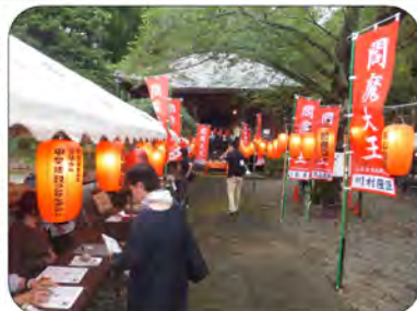
大日堂に向かう両側に提灯と幟

夏の思い出作りにお子様もご一緒にご家族で是非、ご来場下さい。お待ちしております。