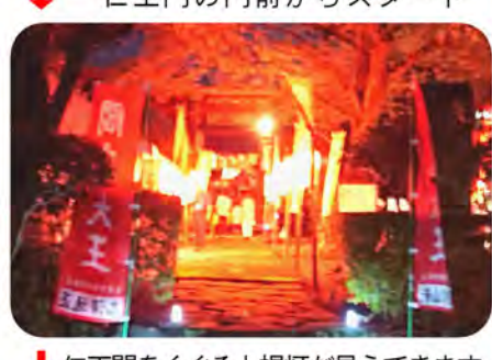
仁王門をくぐると提灯が見えてきます