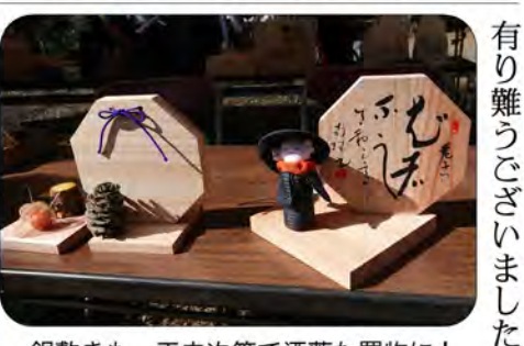
鍋敷きも、工夫次第で洒落た置物に!

物品を持ち寄って頂いていただき、ありがとうございました。山のご寄付・募金も頂きました。そして今回も皆様方