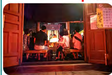
本堂の中では、紙芝居の真っ最中!