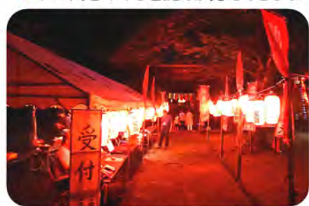
参道の両側の提灯が綺麗です。