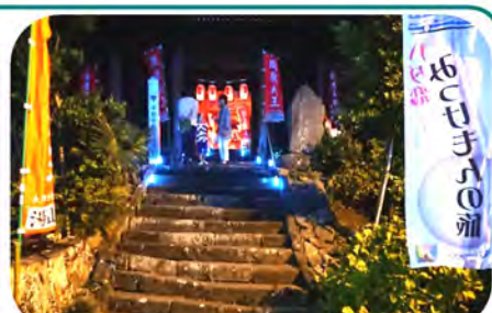
仁王門の門前からスタート