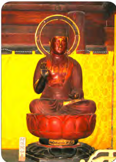
大日堂内の阿弥陀如来坐像

(※) 新型コロナウイルスの影響で今回の総会が中止(延期)になる場合は、一週間前よりホームページ (http://www.minoge-bunka.org/) にてご案内します。またメール、電話でのお問い合わせも可能ですので、よろしくお願ひします。 ・メールアドレス: info@minoge-bunka.org ・電話: 宝蓮寺 0463-81-3528