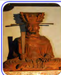
【閻魔大王】主に頭部と右手の修復がされています。