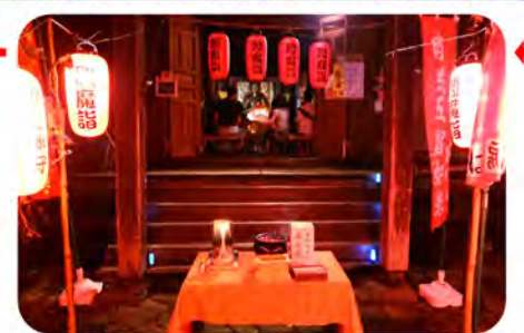
大日堂の本堂前で、ご焼香しましょう。