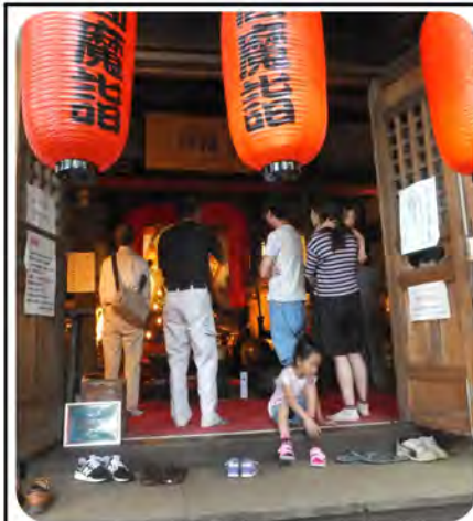
閻魔堂も提灯で飾り付けされます

今年も提灯に加え、のぼり旗の スポンサーも募集しています。 お申込みは事務局まで